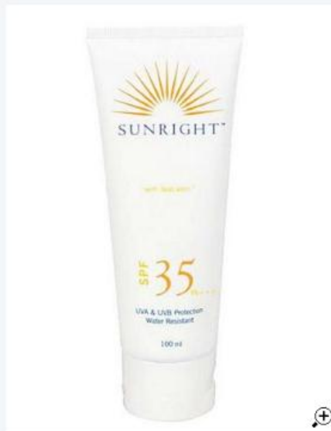
Sunright SPF 35 (23 €), de Nuskín.